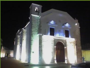
REHABILITACION DE LA IGLESIA DE SAN JUAN DE DIOS