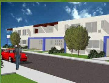
PROYECTO FRACCIONAMIENTO VICA

DISEÑO CONSTRUCCION ACABADOS ACERO HABILITADO RENTA DE MAQUINARIA GUARNICIONES PREFABRICADAS