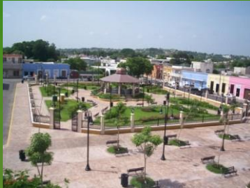
CONSTRUCCION DEL PARQUE DE SAN ROMAN

VICA DISEÑO Y CONSTRUCCION, S.A. DE C.V.